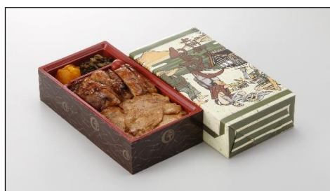
上州御用 鳥めし松弁当 830円（税込）