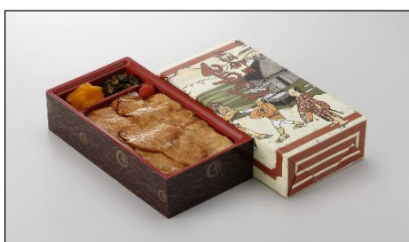
上州御用 鳥めし竹弁当 730円（税込）