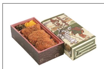
ソースかつ弁当 880円（税込）