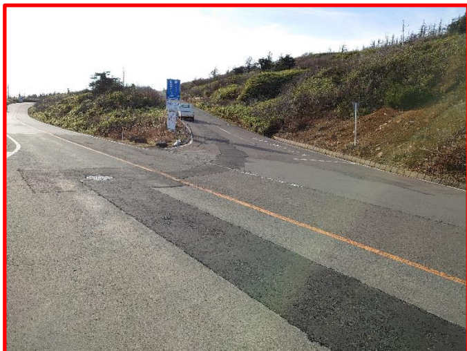
(3) ハイライン入口付近