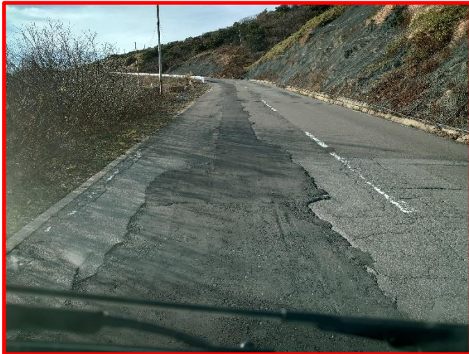
(1) 大黒天駐車場からハイライン入口①