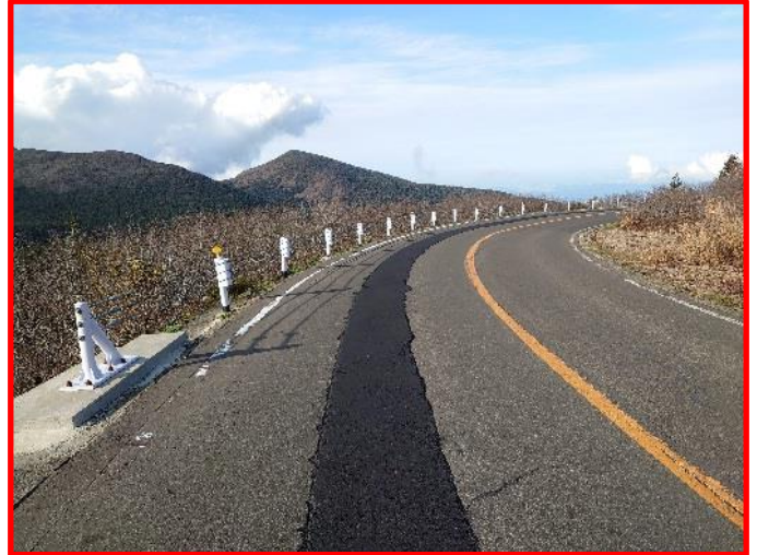
(2) 大黒天駐車場からハイライン入口②