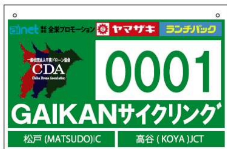
【ナンバーカードプレート】